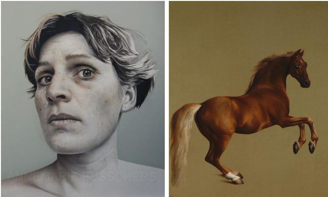
Afbeeldingen: Whistlejacket door George Stubbs en Zelfportret door Annemarie Busschers

Stubbs niet. Bij bijna al zijn schilderijen is een landschap als achtergrond te zien, dus waarschijnlijk is dit schilderij nog niet afgerond geweest. Het is hoe dan ook indrukwekkend, zeker ook door de grootte (296.1 × 248 cm).