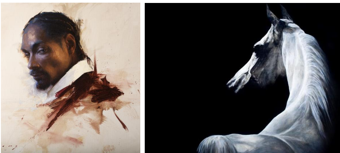
Afbeeldingen: Snoop Dogg door Jeremy Lipking en maker onbekend.

Is je onderwerp over het algemeen heel licht of heel donker van kleur? Dan kan het schilderij extra spannend worden als je de achtergrond juist precies een tegenovergestelde toonwaarde geeft. Dus licht op donker of donker op licht.